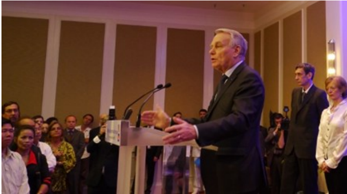
Le Premier ministre français dimanche soir au Raffles Le Royal de Phnom Penh

De fait, l'Asean, économiquement dynamique mais politiquement faible, peine à rivaliser face aux rouleaux-compresseurs japonais, chinois, indien. Ne serait-ce qu'en termes de volumes d'échanges et d'investissements lourds. "Cela serait une erreur de miser (en Asie) uniquement sur la Chine, tout comme cela le serait avec le Brésil en Amérique latine", soulignait-on pour autant à Mati-